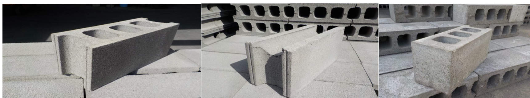
空洞ブロック 隅用(コーナー)